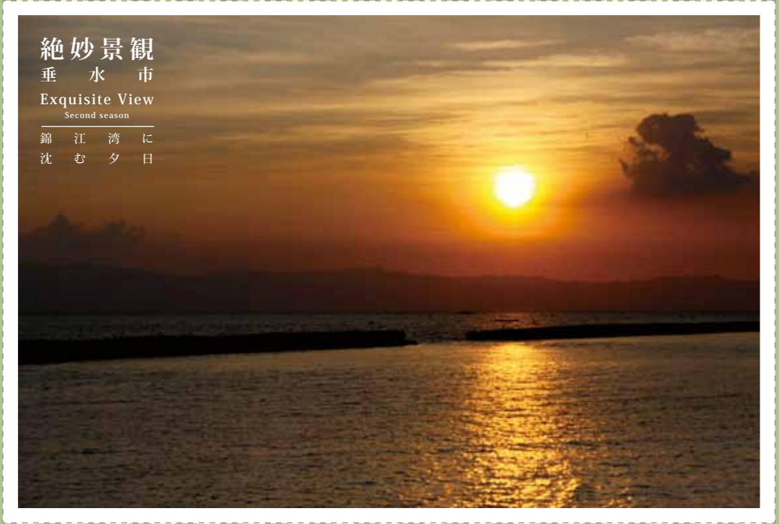
絶妙景観 垂水市 Exquisite View Second season 錦江湾に 沈む夕日