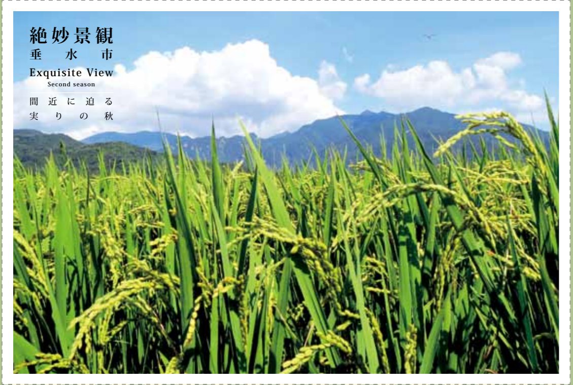
絶妙景観 垂水市 Exquisite View Second season 間近に迫る 実りの秋