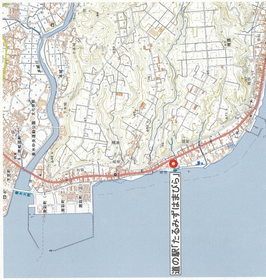
道の駅「たるみずはまびら」