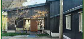
ギャラリー瓦 休館日/日