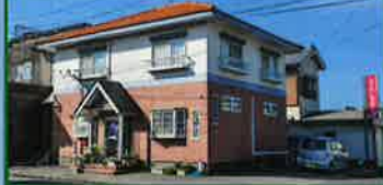
ギャラリーレブロン 休館日/日・月