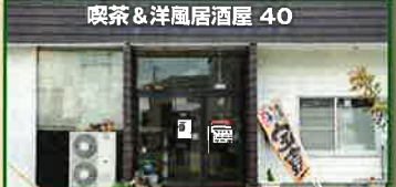
喫茶&洋風居酒屋 40 ギャラリーヨンマル 休館日/不定休