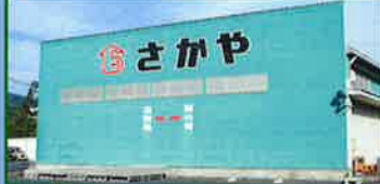
ギャラリーさかや 休館日/日