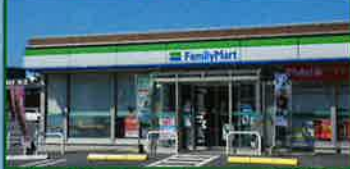
ギャラリーきたかた 休館日/ファミマ 無 北方酒店 日

⑤ ファミリーマート北方浜平店 ☎31-3031 そつやきたかた(北方酒店) ☎32-0665