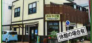
ギャラリー中村 休館日/不定休