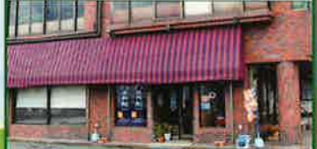
ギャラリー八木 休館日/日