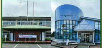
市民ギャラリー 休館日/市民館 無 図書館 月