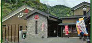
ギャラリー財宝 休館日/火