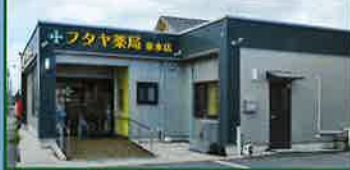
ギャラリーフタヤ 休館日/日・祝

⑤ ファミリーマート北方浜平店 ☎31-3031 そつやきたかた(北方酒店) ☎32-0665