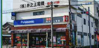
ギャラリー井之上 休館日/日