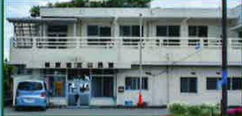
ギャラリー柁原 休館日/水・土・日